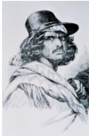
Joakin Murrieta, garai haietako gaistagin handia