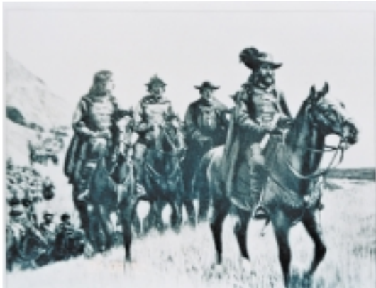
Juan Bautista Anzak egin zuen lehen aldikotz Mezikatik eta Kaliforniarako bidea, lurrez 1774an. Bere aitona Hernaniarra, Kalifornian zen 1712n