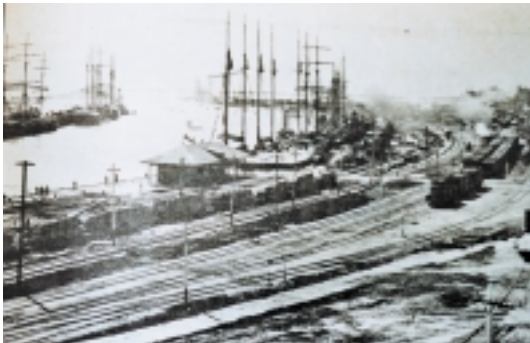
Los Angelesetako portua