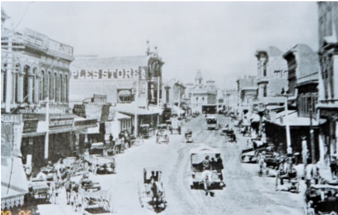
Los Angelesetako karrika bat lehen