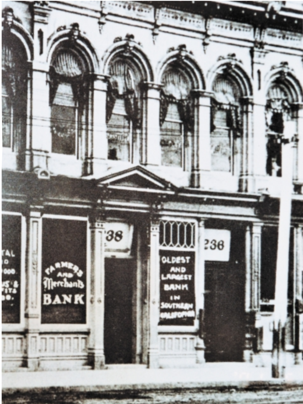
Farmers and Merchant's Bank, Goytinoren bankoa. Amestoy sortzailletarik bat zen