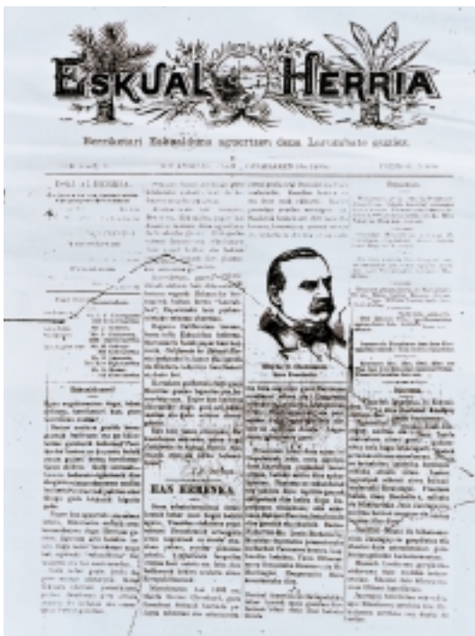
Californiako Eskual Herria -ren lehen alea

Ilusioz beterik hasten da: «Bertze nazione guziek beren gazetak badituzte eta gu, hainbortez garelarik hedatuak Pazifiko kostan, ez da justu baizik junta giten denak berrikeriari baten medioz. Gure interesak, hemen bederen, igualtsuak dira eta gure mintzaira ederraren medioz bat bertzen berriak jakiten ahal ditugu gure lekutik higitu gabe.