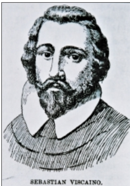
Sebastian Viscainok egin zuen Kaliforniako kostaldeko lehen mapetarik bat