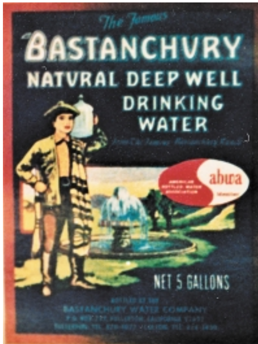
Bastanchury ura, botoiletan

Bainan nola irau du 5 urtez ez bazen erren-tagarri? Biscailuzekin ikusi dugu 75 harpidedun aski zitzaizkiola inprimategia pagatzeko. Hortik haratekoa, posta saria pagatu eta, egi-learentzat beraz. 300 bat harpidedunekin mila dolarrez goiti sartzen zen urtean, publizitatea bestalde. Eta publizitatearentzat, irakurleek pagatua zuten ala ez, berdin balio zuen, kazeta irakurtzen zuten.