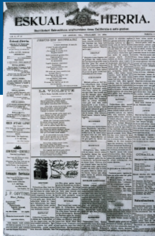
Californiako Eskual Herria-ren azken alea

Zer aipatzen duen? Lehen orrialdean baditugu Munduko eta Iparraldeko berriak, lehenik Eskualduna -tik hartuak, gero Le Réveil Basque ere baliatzen du. 1893ko agorrilaren 20an hauteskunderak izan direlarik Frantzian, ondoko larunbatean berean ematen ditu ondorioak: telegrama baliatu duke horretarako zeren eta Euskal Herriko ondorioak 3 asteren buruan baizik ez ditu agertu ahal izan herriz herri: hemengo kazetatik ari zitekeen eta hauek itsasontziz joan behar Estatu Batuetara eta, beste hainbeste bide gelditzen Atlantikotik Pazifikora iragaiteko.