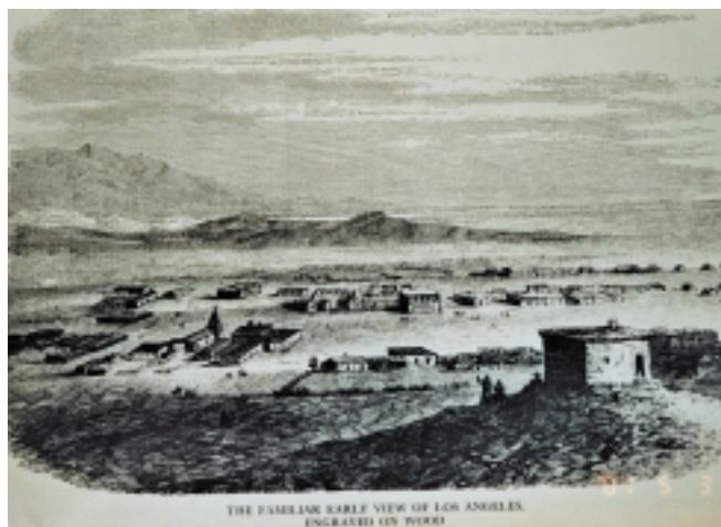
Los Angeles XIX. mende hasieran