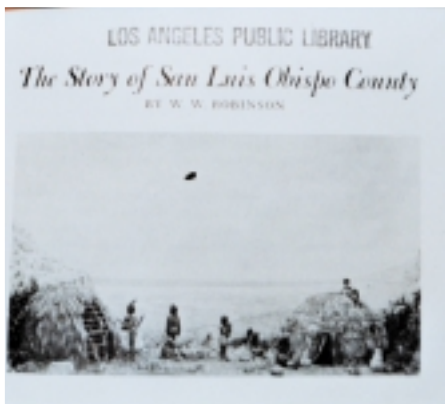
Indioak beren lastozko etxolekin