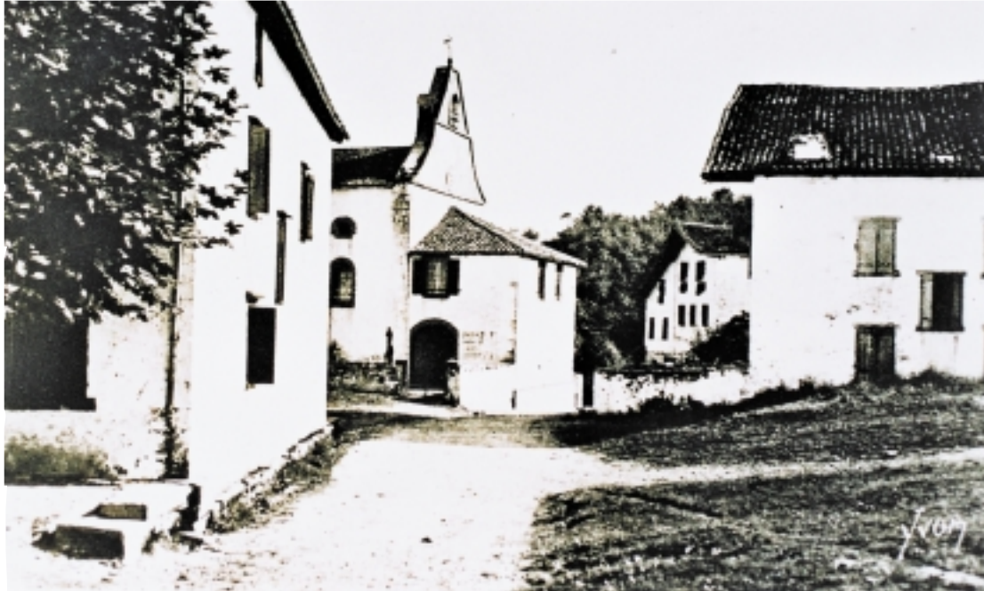
Eskola, eliza ategaineko sala horretan egiten zen Zuraiden

Ondoko urtean, Latsiako eskolara igorri zuten, zigorrez, Itsasuko mendialdean baldintza beretan ari zela, haur guziak klase bakar