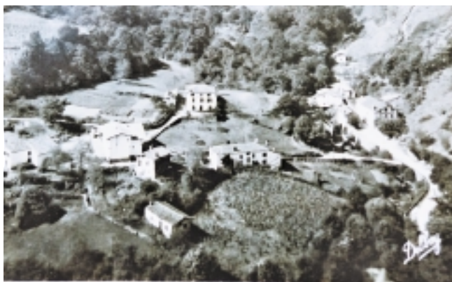
Latsiako auzoaldea Itsasun. Ezkerretarik bigarren etxea: eskola