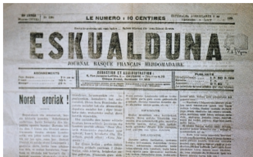
Eskualduna «xurien» kazeta

Kazetaritzaz beste lan askorentzat ere Goytino dei egiten diote: Auzitegian itzultzale bat behar delarik euskaldun batentzat, hil den euskaldun baten ondasunak estimatu behar direlarik.