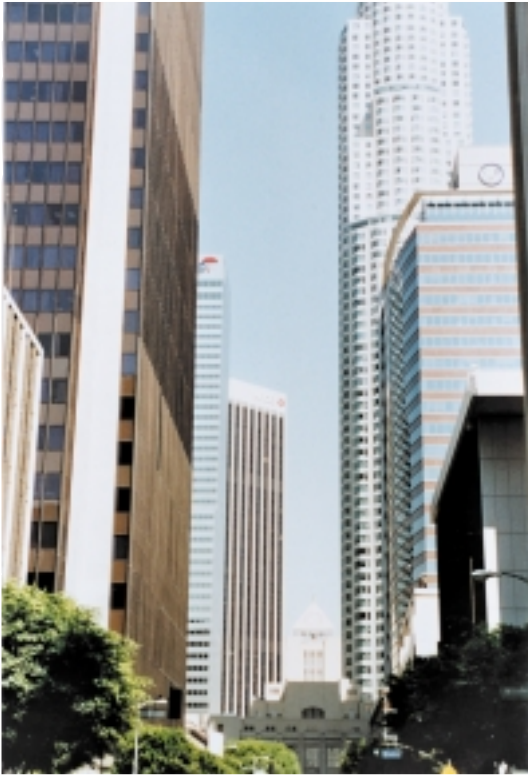
Los Angelesetako karrika bat orai

OJDrik ez baitzen. Zenbaki batetan erraten du 750 harpidedun bazituela. Hori ere ezin erran zein heinetaradino egia den.