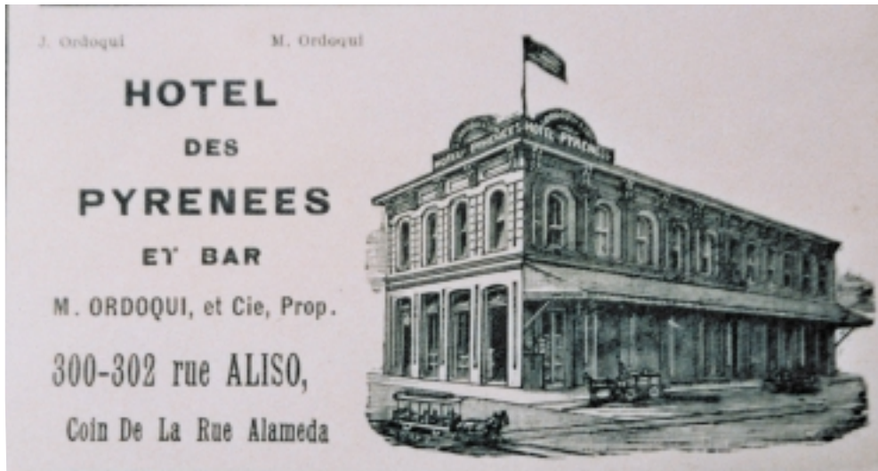
Hotel des Pyrénées, Ordoquiren hotela